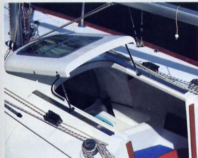
L'apertura a compasso del tambuccio permette di ottenere una zona con altezza sufficiente a stare eretti. Ma facilita anche l'ingresso sottocoperta e migliora la circolazione d'aria.