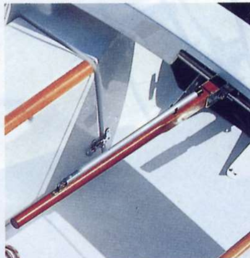
Le due pale del timone sono collegate da una biella regolabile in acciaio inox, su cui si intesta la barra del timone in mogano dotata di stick.