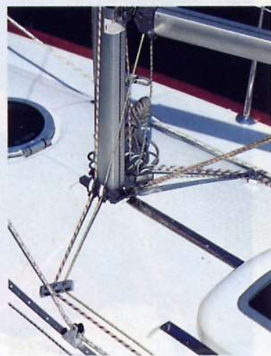
Le rotaie del genoa poste sulla tuga liberano i passavanti e permettono di stringere molto bene la bolina.