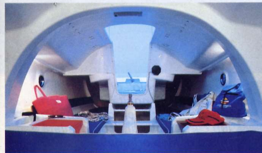
Anche strutturalmente, il First 210 presenta parecchie soluzioni originali: niente puntelli per sostenere l'albero poggiato in coperta, bensì questa omega realizzata nel controstampo. In primo piano il meccanismo della deriva mobile posto sopra la scassa.