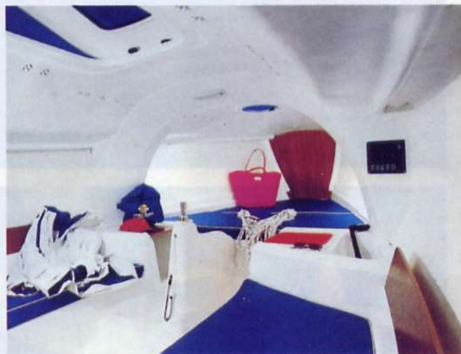
Gli interni sono semplici ed essenziali, con quattro posti letto in un unico locale, ben aerato e luminoso. Il controstampo riveste gran parte delle superfici, dando un tono "hi-tech" all'ambiente.