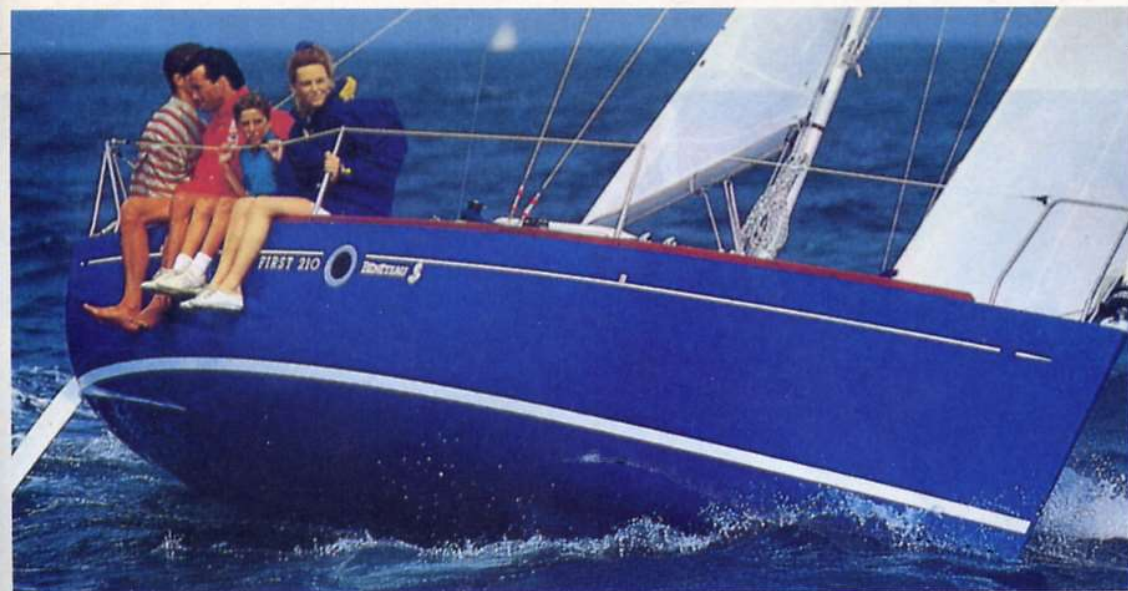
A pochi mesi dalla presentazione ufficiale, il First 210 ha già riscosso un grande successo, tanto che in Francia è stato eletto "Barca dell'anno 1993". Pur essendo concepito per la crociera costiera, ha dimostrato di possedere i numeri per diventare un piccolo monotipo da regata. A detta di chi lo ha provato, le sue prestazioni sono infatti entusiasmanti.